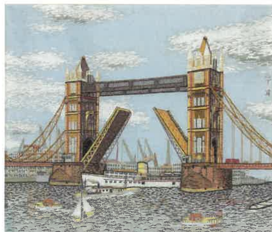
◀ロンドンのタワーブリッジ▶貼絵 1965年