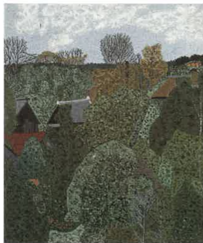
◀市川の風景▶油彩 1951年