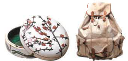
◀花もも(丸箱)▶色絵漆物 1956年