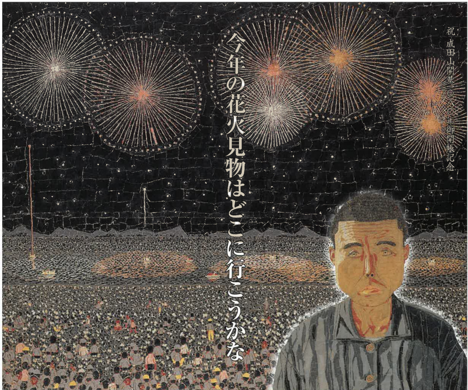
《長岡の花火》(部分)貼絵 1950年 《自分の顔》(部分)貼絵 1950年